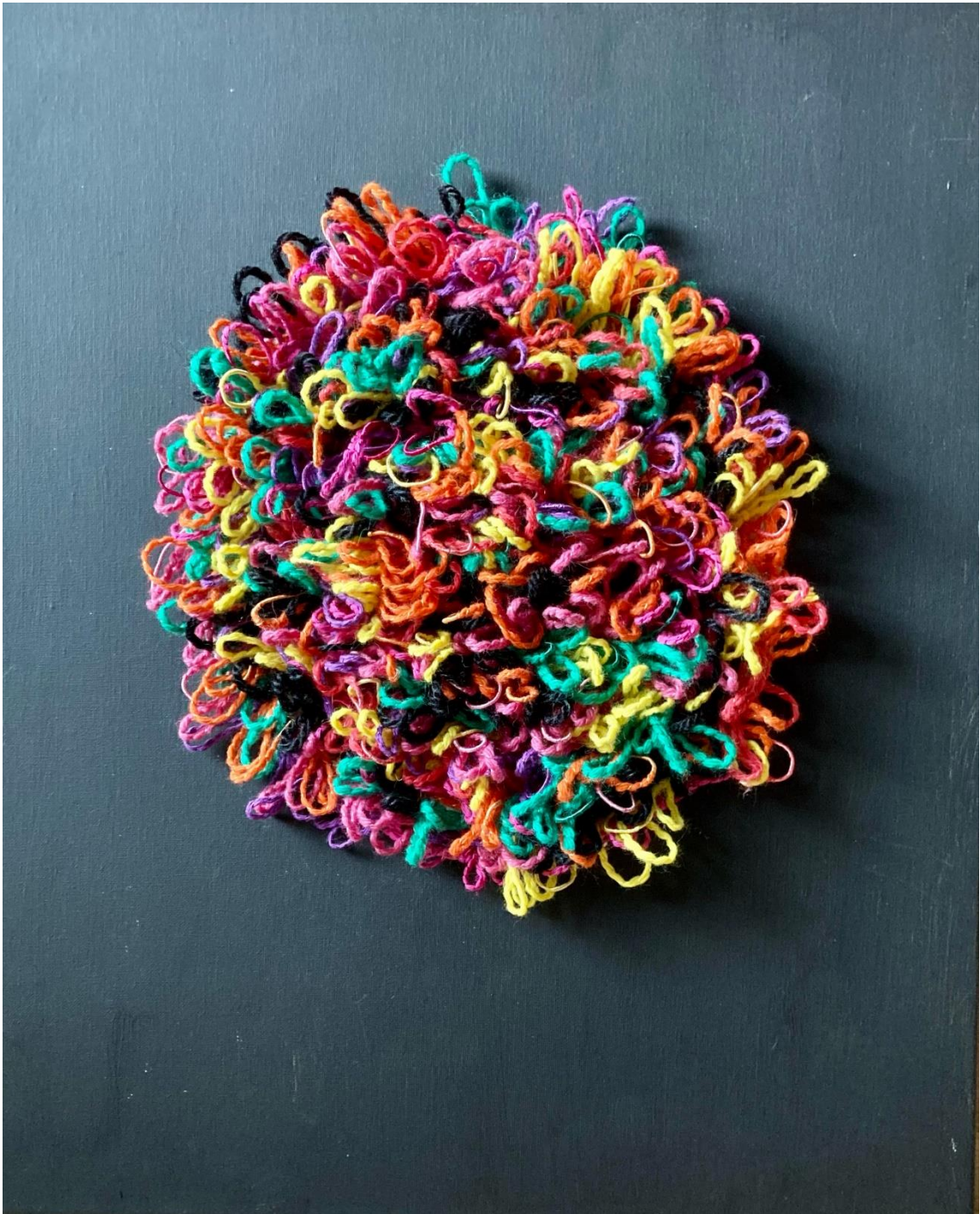
9 - Mapg - Lana sobre lienzo – 2021 – 46x37 cm