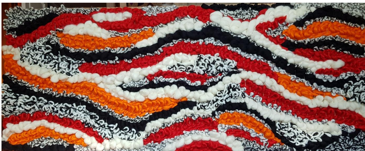
20 – Mapg – Lana – 2023 – 130x55 cm