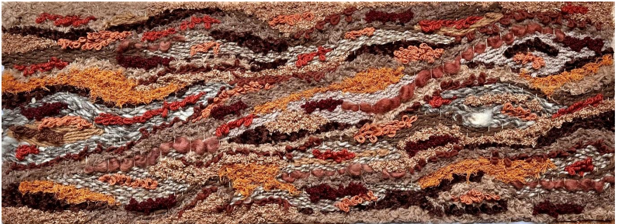
22 – Mapg – Lana – 2023 – 140x55 cm - 2024