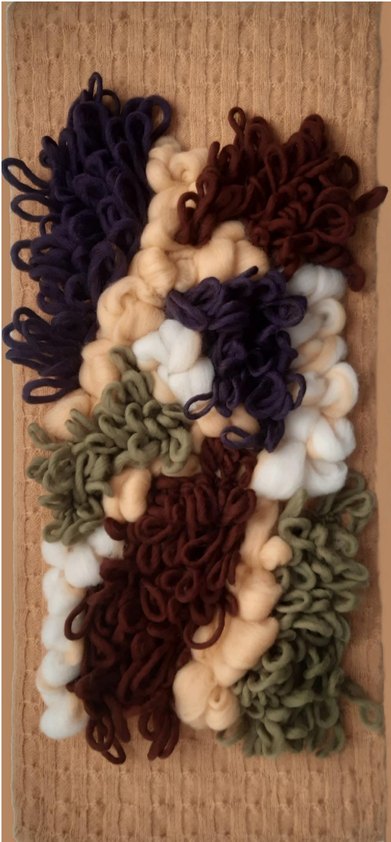
12- Mapg - floca y lana sobre tejido de lana – 2021 – 56x25 cm