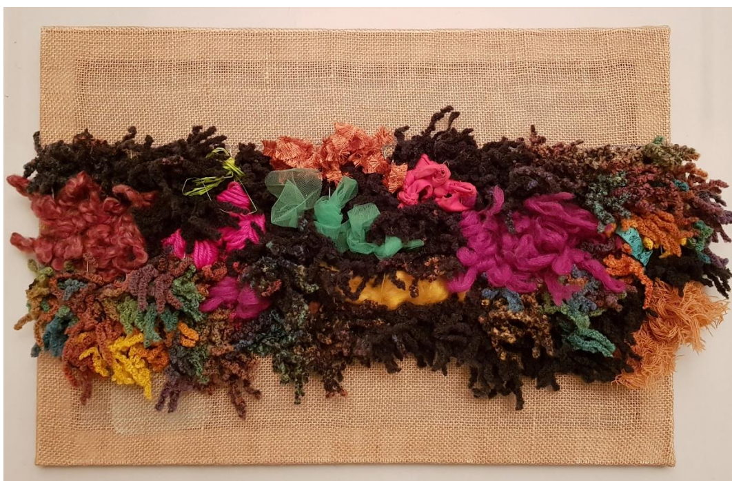
7 - Mapg – “La montaña” lana sobre arpillera – 2017 – 60x40 cm