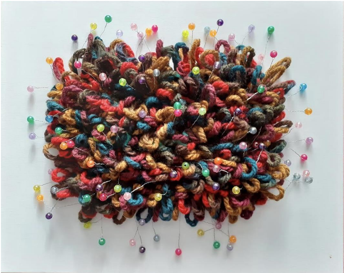
14 - Mapg - Lana sobre lienzo – 2021 – 40x33 cm