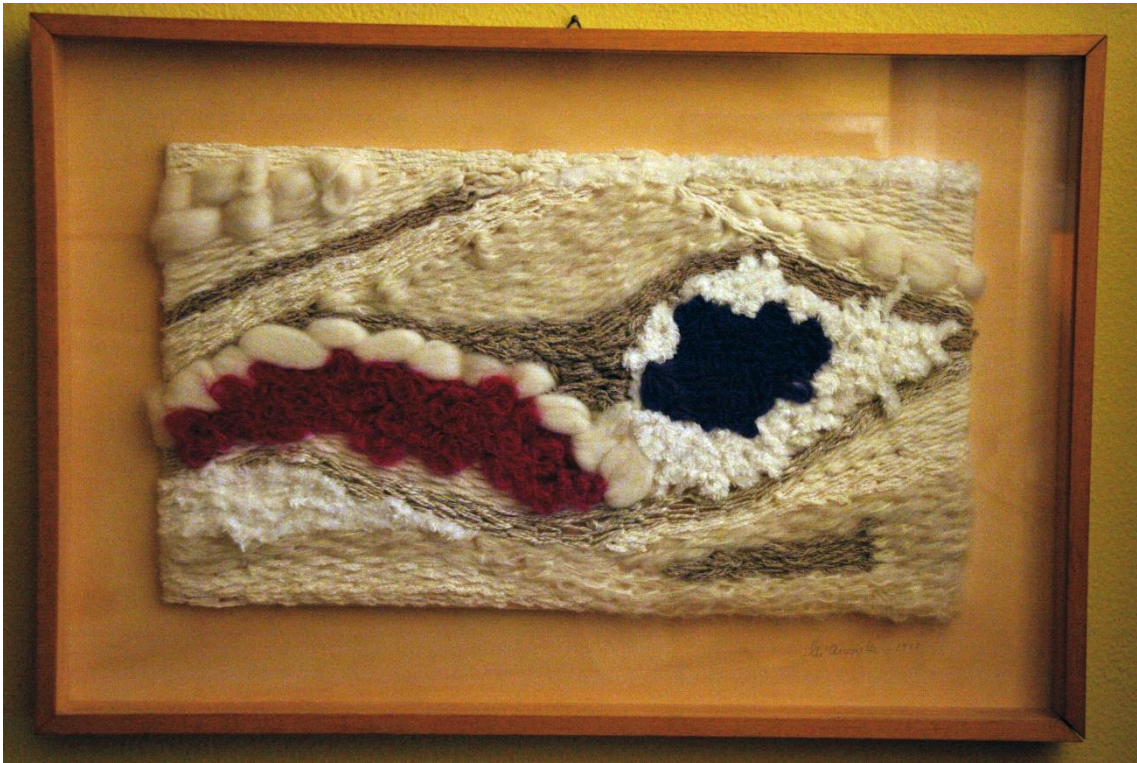
2- Mapg – lana y floca sobre trama – 1987 – 79x53 cm - Spoleto, Festival dei Due Mondi