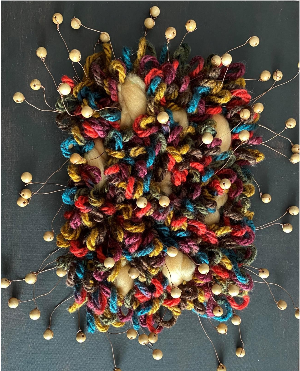
13 - Mapg - Lana sobre lienzo – 2021 – 40x33 cm