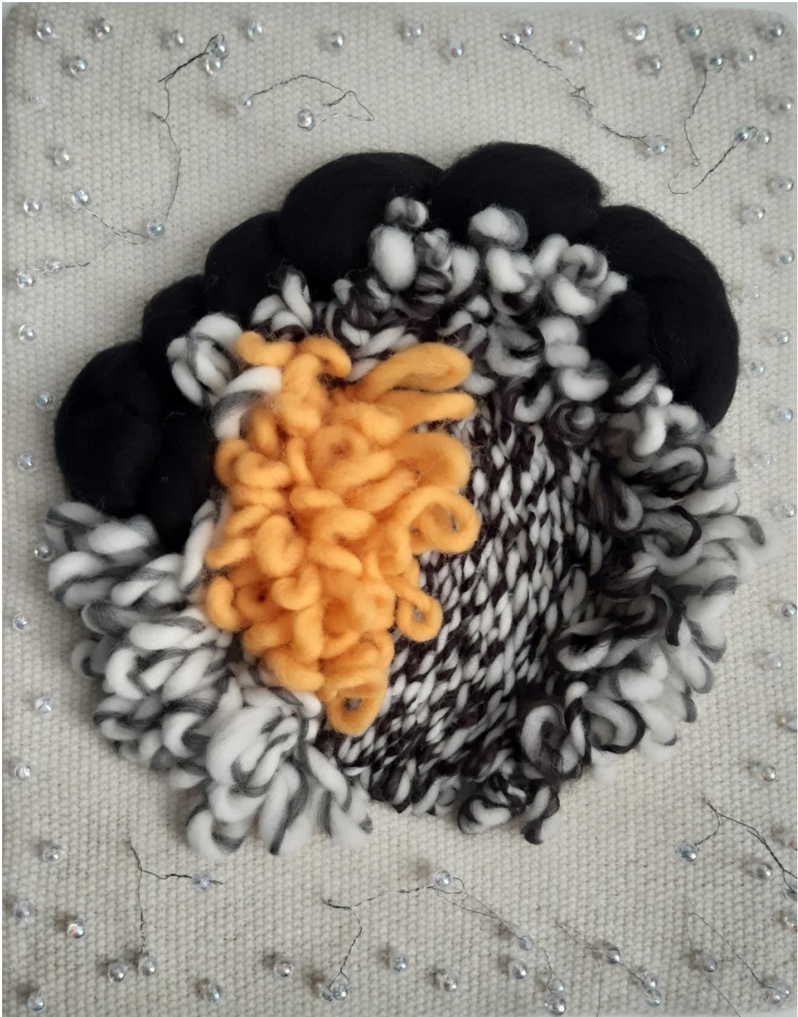
11- Mapg – floca y lana sobre tejido de lana – 2021 – 30x25 cm