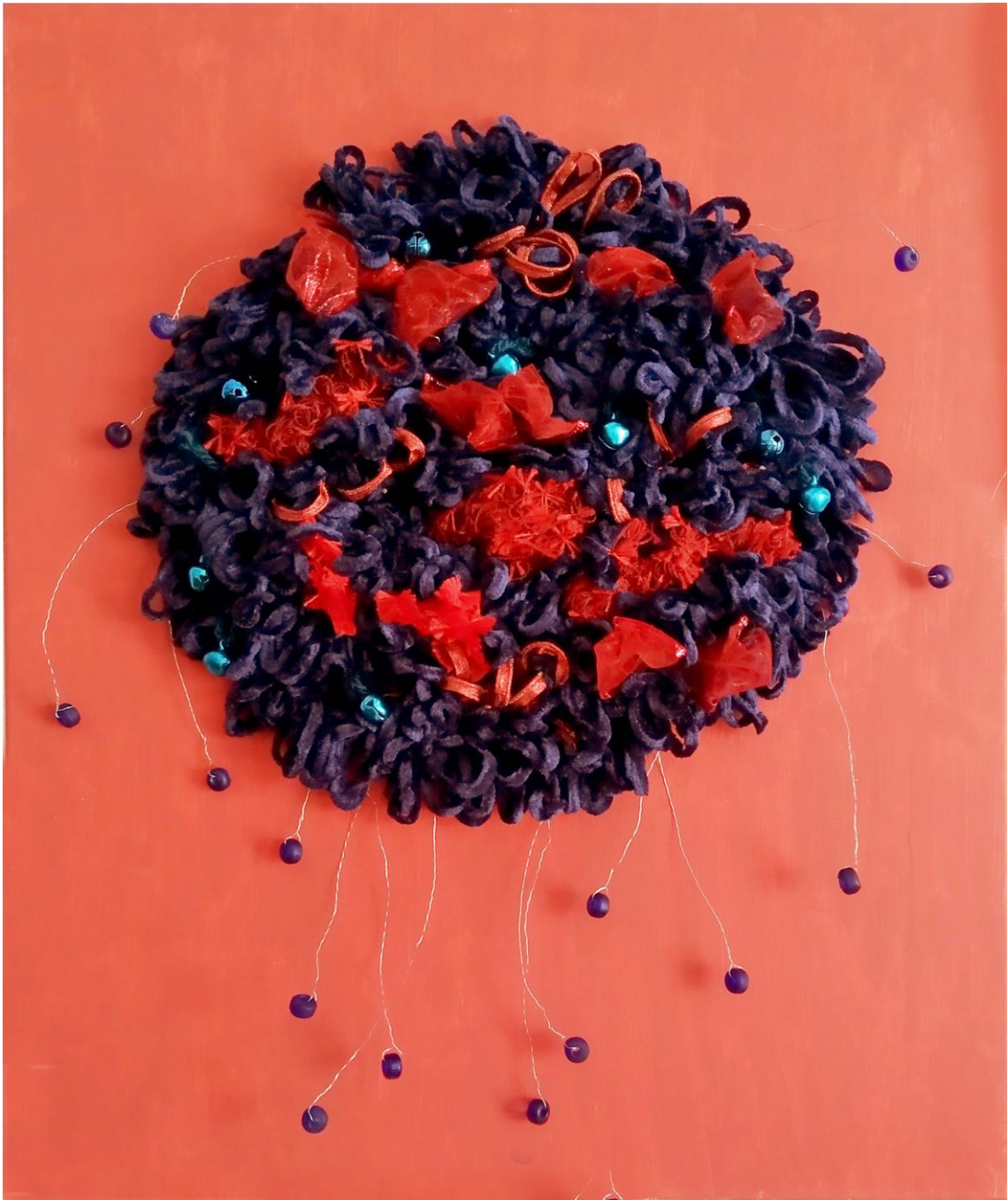
16 - Mapg - lana sobre lienzo – 2022 – 38x46 cm