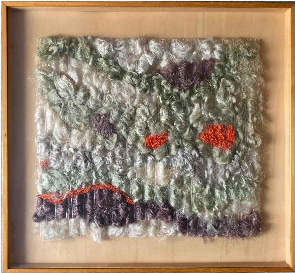
4- Mapg – seda de mediados de 1800 sobre trama – 1987 – 80x74 cm - Spoleto, Festival dei Due Mondi