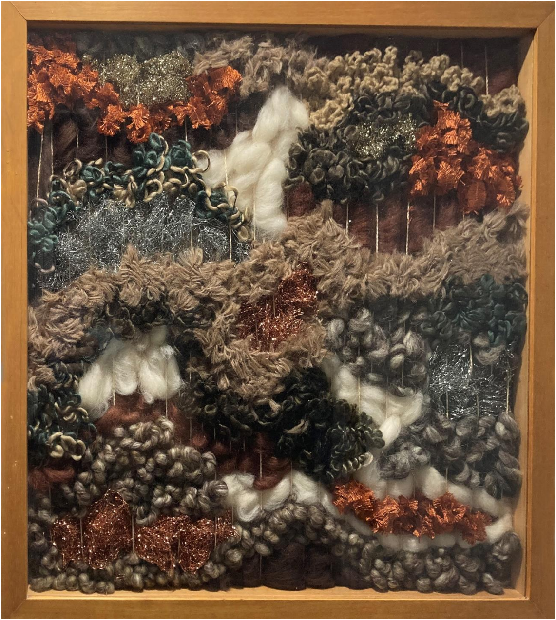
8 - Mapg – floca, lana, chenilla y estropajos de metal – 2021 - 48x48 cm