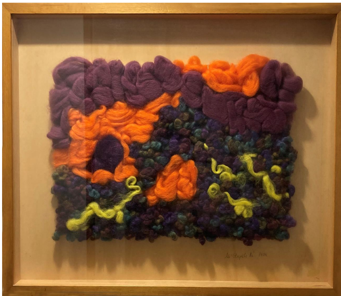
1- Mapg – floca y lana sobre trama – 1987 – 58x47 cm - Spoleto, Festival dei Due Mondi