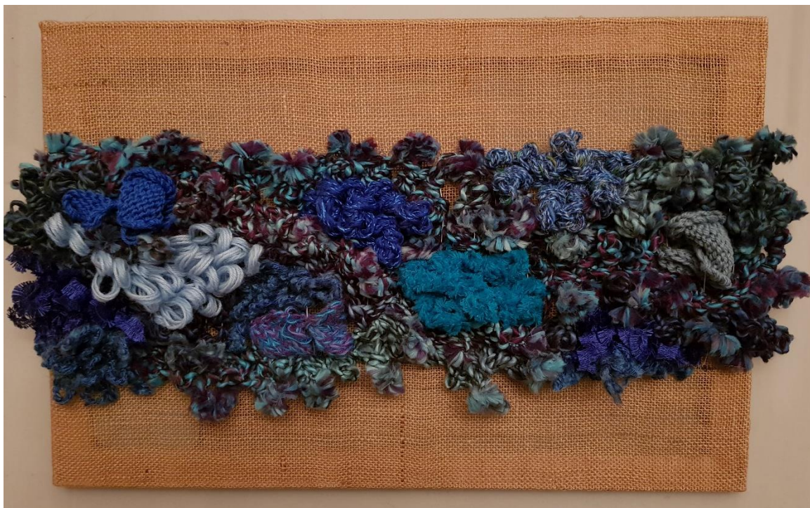
6 - Mapg – “El mar” - lana sobre arpillera – 2017 – 60x40 cm