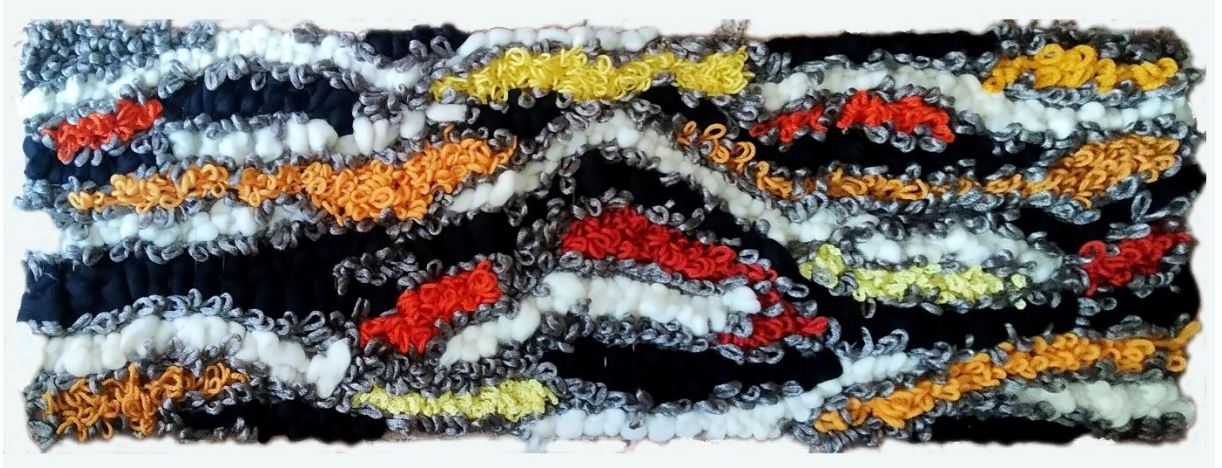
21- Mapg – Lana – 2023 – 130x55 cm