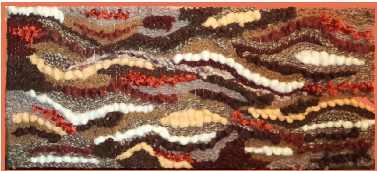
19 – Mapg – Lana – 2023 – 130x55 cm