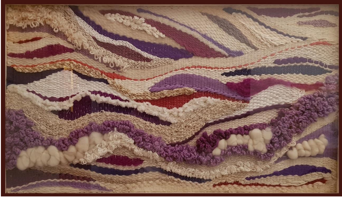
5- Mapg – lana y floca sobre trama – 1987 – 112x64 cm – Castillo de los Templarios, Zerbo (Pavía)