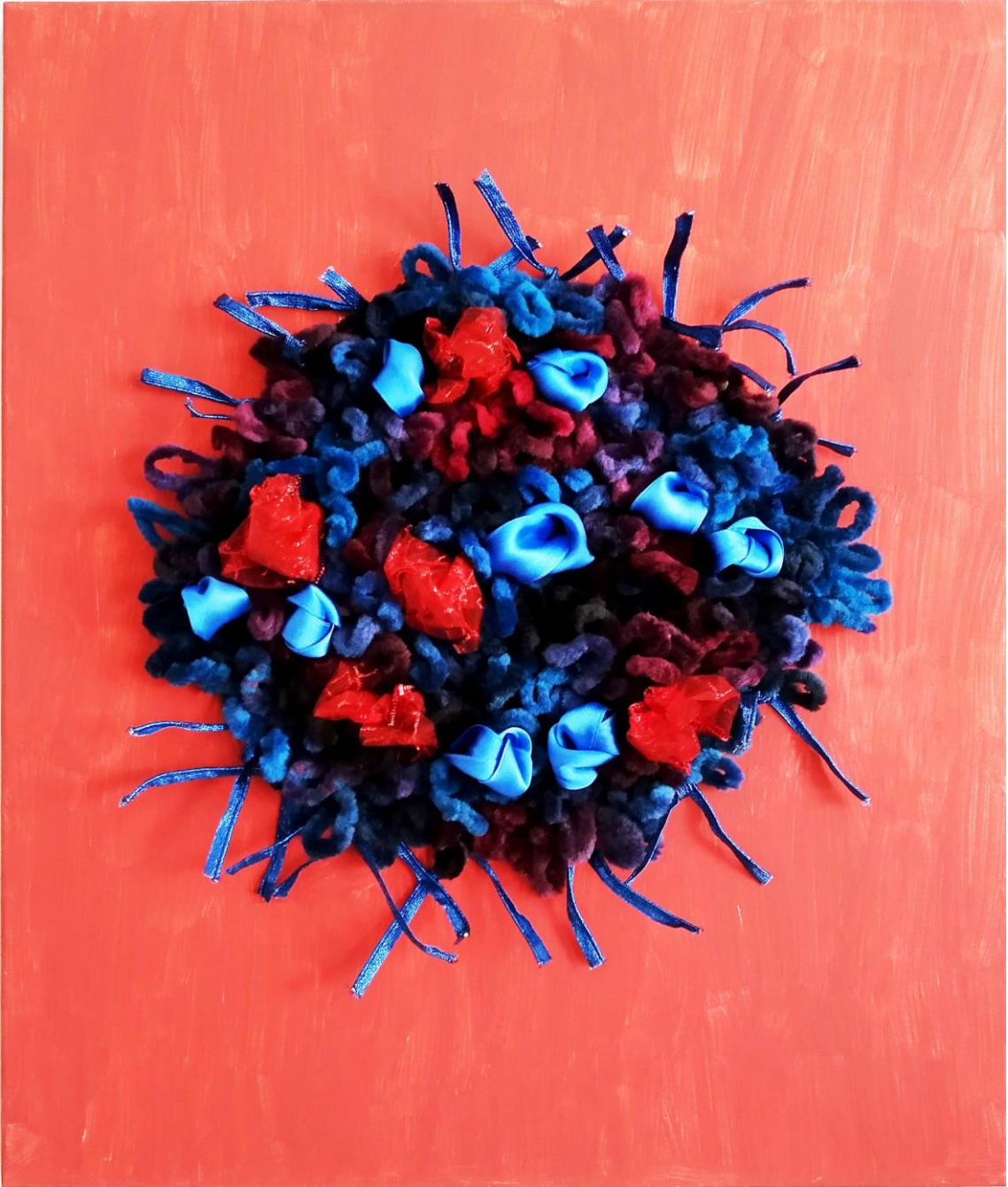
17 - Mapg - lana sobre lienzo – 2022 – 38x46 cm