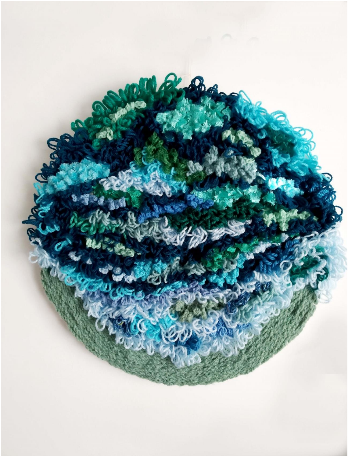
18 – Mapg - “The sea I love” – diversos materiales lanosos – junio de 2022 – 50 cm