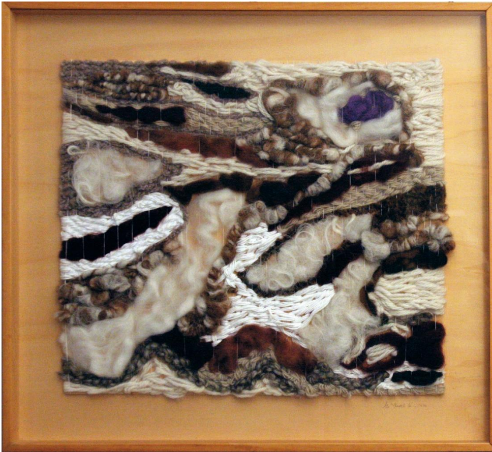
3- Mapg – floca y lana sobre trama – 1987 – 90x72 cm - Spoleto, Festival dei Due Mondi